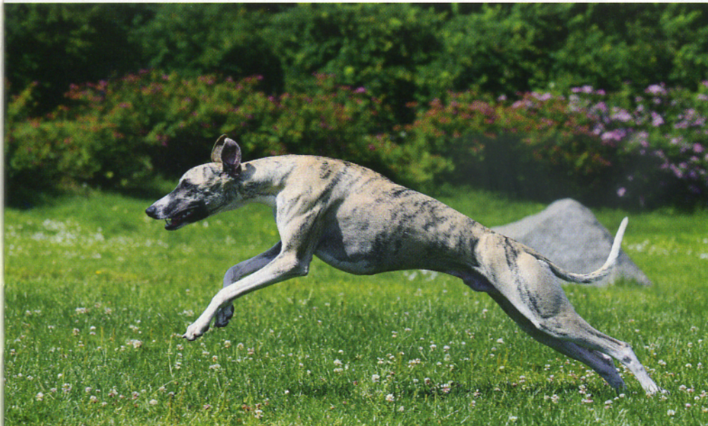
Vauhdin vuoksi rotu on tapaturmille altis.

rille on jo käynyt. Greyhoundien juoksulinjaisia ja näyttelykoiria kun ei välttämättä tunnista enää edes samaksi rodoksi, mietiskelee Stöckell. – Geneettisesti katsottuna linjajako sitä paitsi kaventaa jalostusmateriaalin vain populaation osajoukkoon.