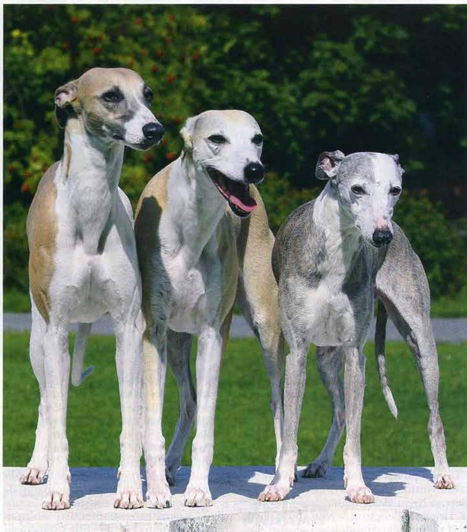
Koirasosiaalinen ja tasapainoinen whippet voi elää onnellisena suuremmassakin laumassa.

Whippetien taustoista löytyy ripaus terrieriä, joka osaltaan vaikuttaa sen luonteeseen. – Whippet ei Englannissa tehtyjen roturisteysten vuoksi ole yh-